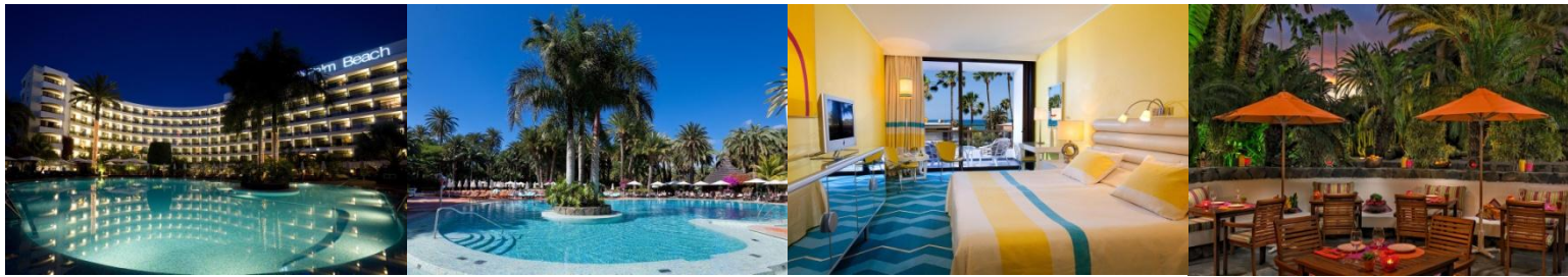
Bilder vom mondänen und unterhaltsamen 5* SEASIDE HOTEL PALM BEACH mit großem Freizeitangebot