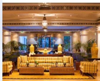
ganz fein, ganz spanisch