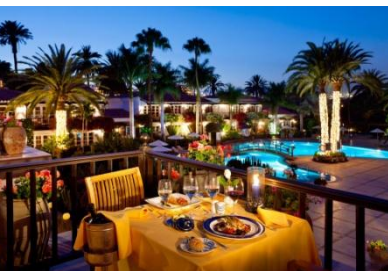
Verwöhnhotel der Extra-Klasse